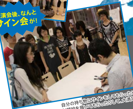
自分の持ち物にサインをしてもらったり、 似顔絵を描いてもらったりして、大満足!