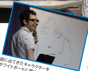
話に出てきたキャラクターを ホワイトボードに描くシーンも!

講演会には多くの学生が参加。学生時代のエピソードからゲーム業界に入るまで。人気ゲーム制作秘話など、クリエイターを目指す学生たちにとって興味深い話がたくさん聞けました。「夢を叶えるために、目標をしっかりと持って人生を送ることが大切」というアドバイスには、みんな真剣な顔で聞き入っていました。質問コーナーにも多くの手が上がり、充実の講演会になりました!