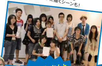
講演会后、なんと サイン会が!