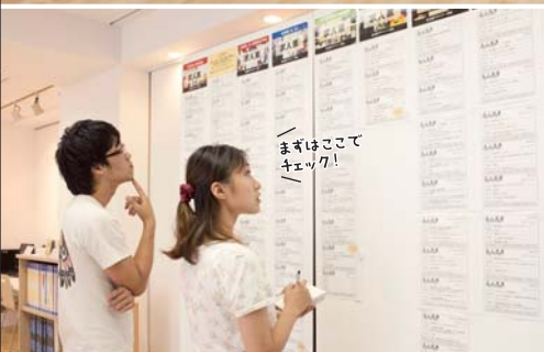
場所:名古屋デザイナー学院1階

P.I.C.S. Public Information Career Support Center