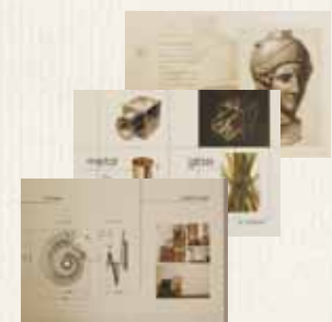
研究を重ねて完成したポートフォリオ。

自分が子どもの頃に、ポスターやお菓子の 箱を見てワクワクした気持ちを、 今度は自分がつくる側になって デザインしていきたいです！